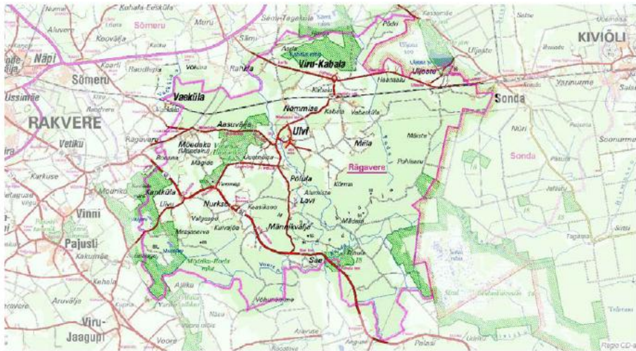
Joonis 1. Rägavere valla kaart

Paiknemisest tingituna on Rakvere selge tõmbekeskus, nii hariduse, tööhõive kui ka kaubanduslikus ja kultuurilises mõttes.