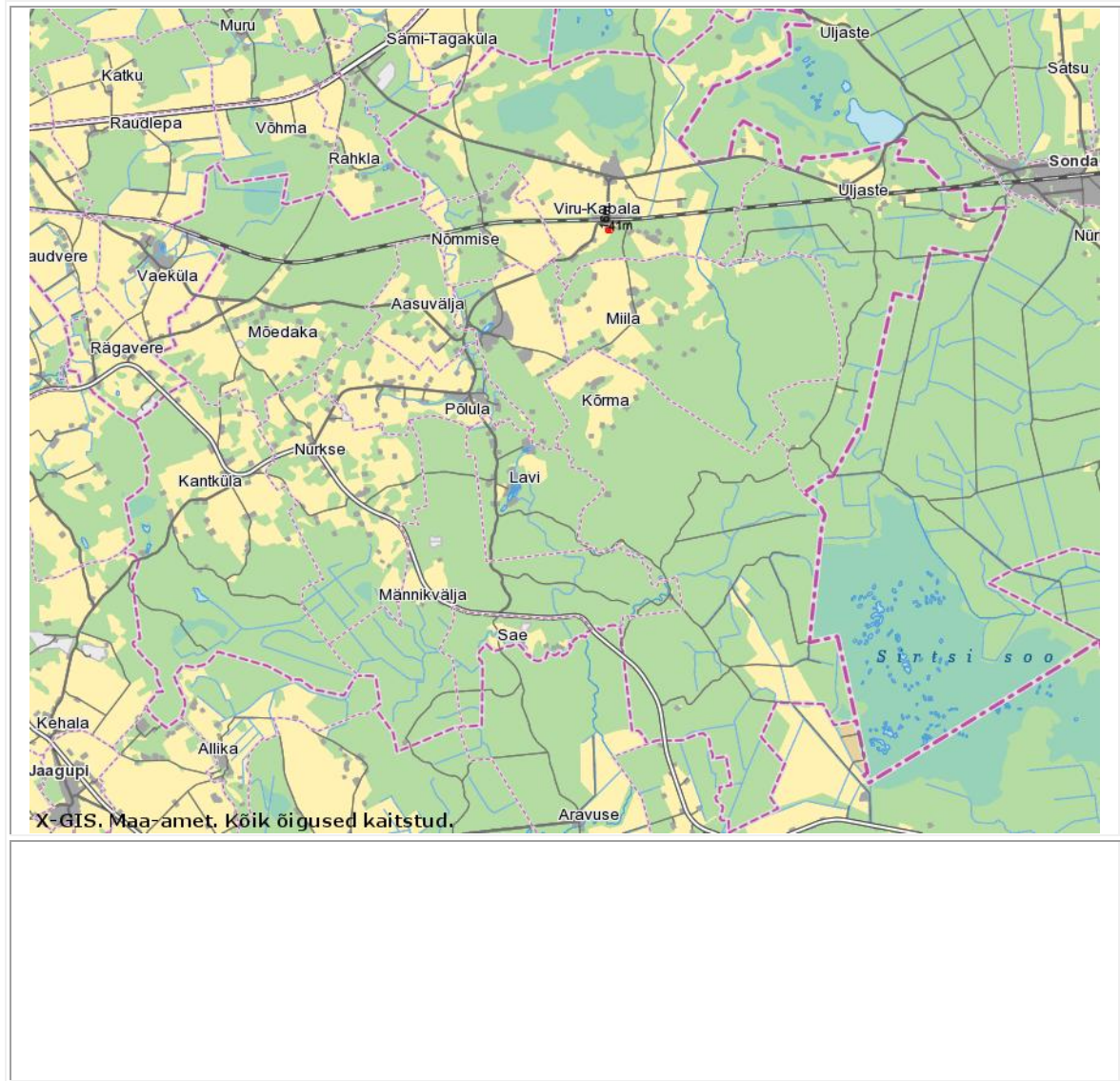
Joonis 2 Rägavere valla külad

Rägavere vallas on 14 küla (vt Joonis 1), suurim neist on Ulvi küla. 01. jaanuari seisuga 2014 oli vallas registreeritud elanike arv 890. Rahvastiku tihedus vallas on suhteliselt väike 5,1 in/km 2 .